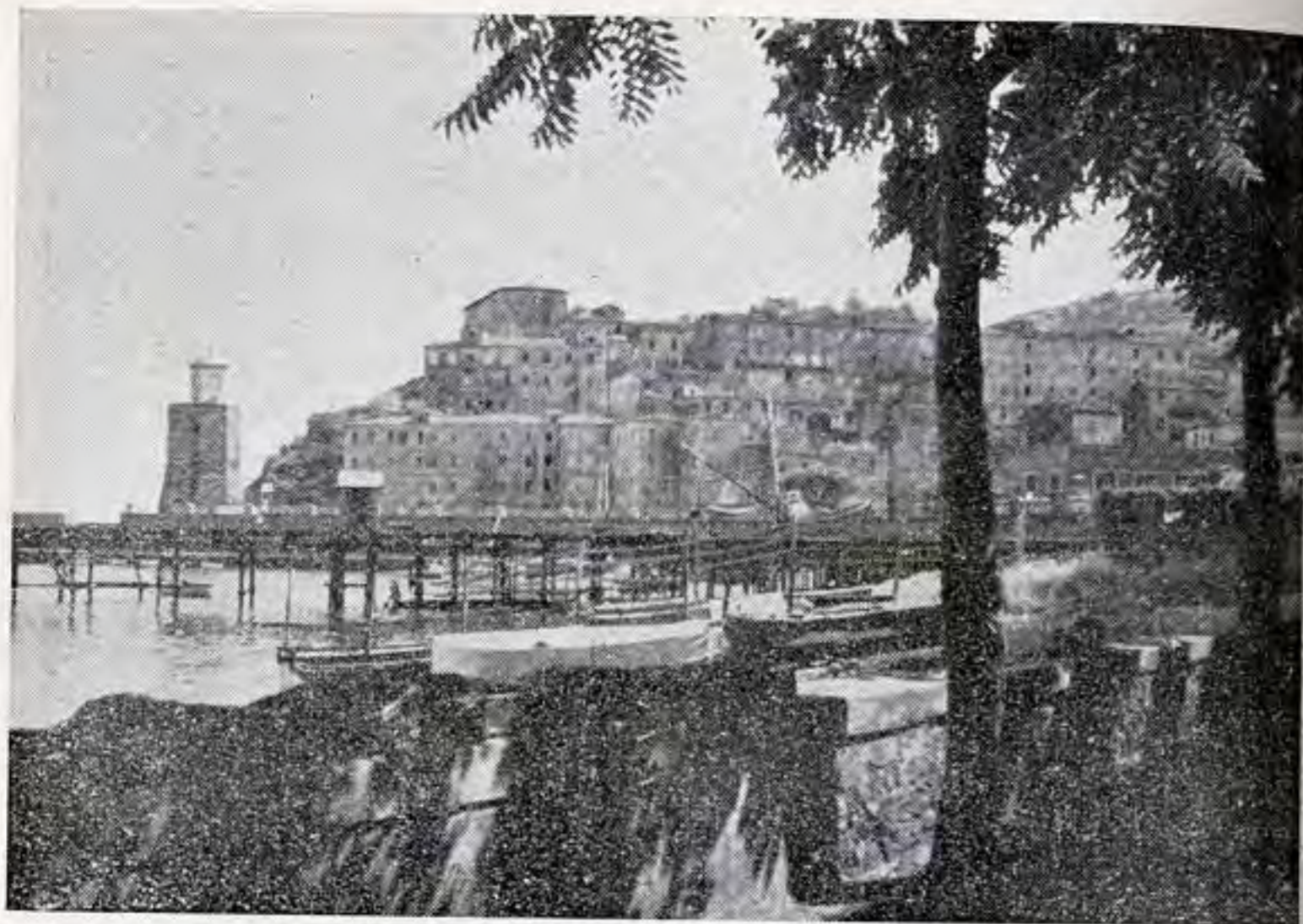
Rio Marina : la Torre