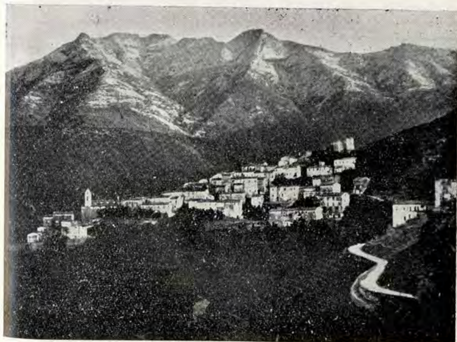
Marciana nella cornice del Capanne