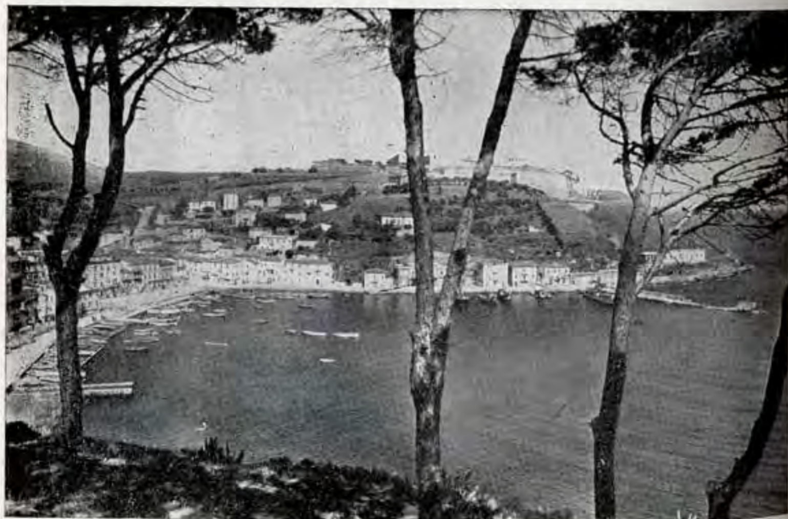
Porto Azzurro : panorama Fotocelere Torino - Ediz. Mario Giuliano Tognoli - Livorno

Chiarito questo particolare diamo uno sguardo al paese che si presenta pulito e ordinato: una bella piazza alberata sul mare ne è il centro solatio, e vi sciamia la leggiadra gioventù locale nelle cui vene scorre il sangue elbano incrociato con quello di tutti i paesi rivieraschi del Mediterraneo.