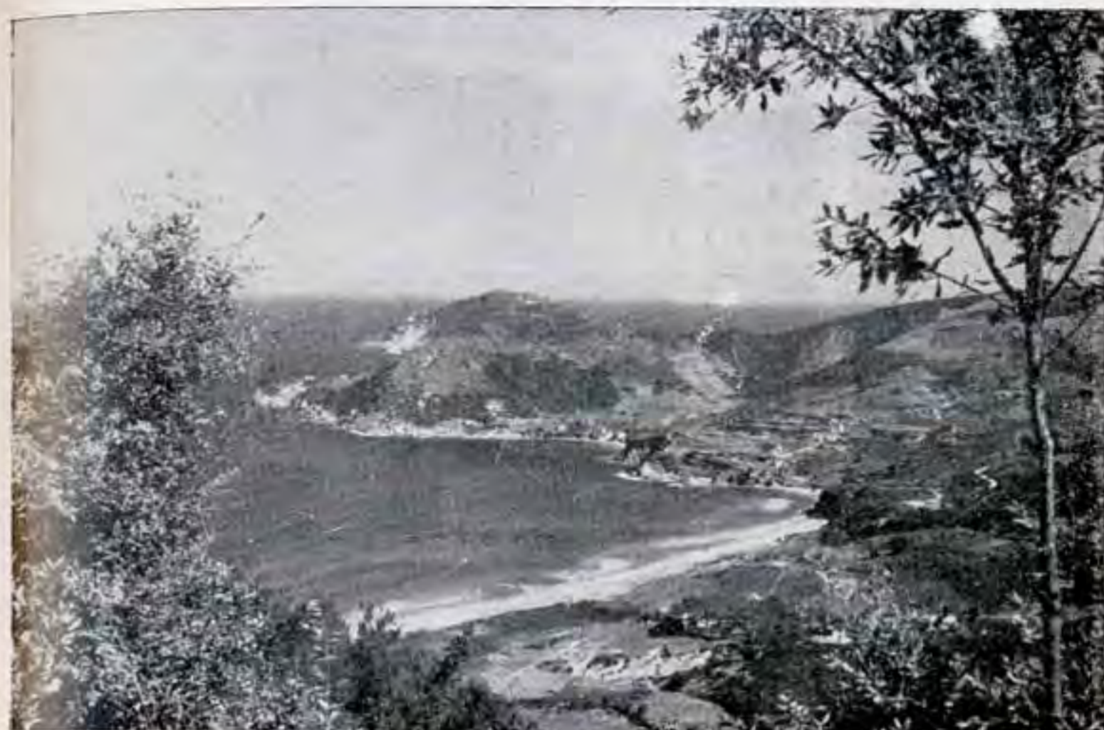
La spiaggia della Biodola