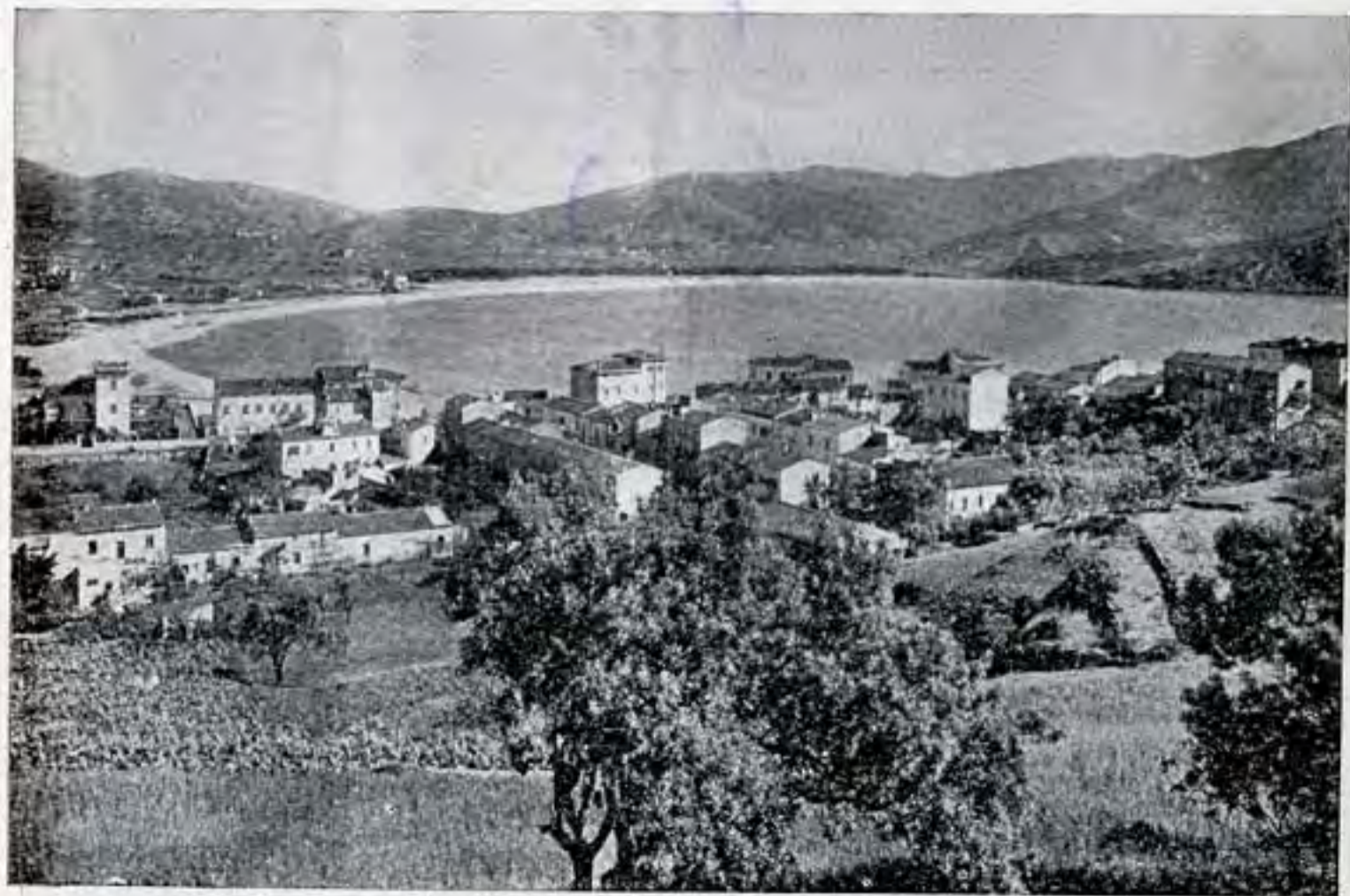
Marina di Campo: la spiaggia e la pineta