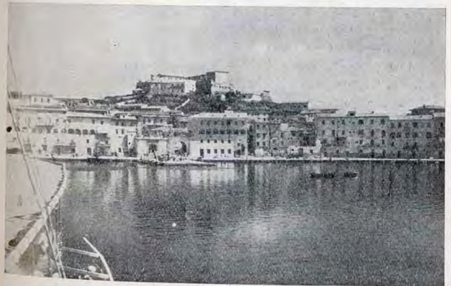
La darsena di Portoferraio