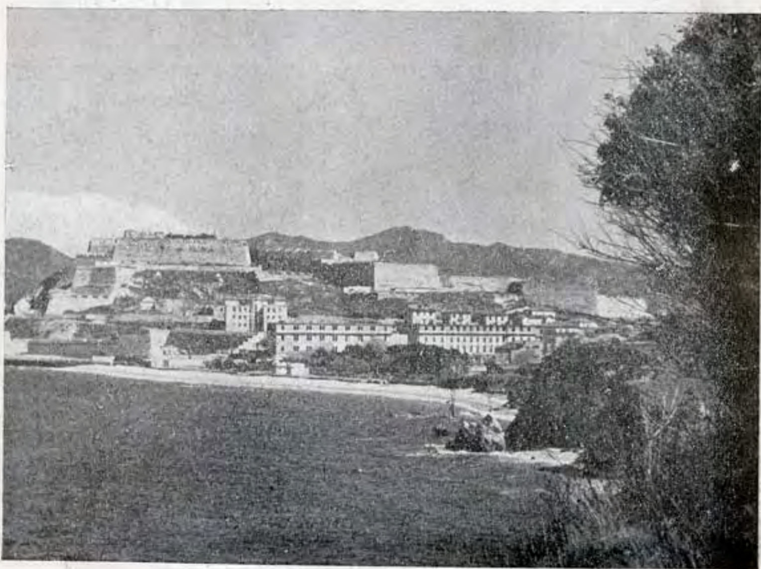
Portoferraio: la spiaggia delle Ghiaie