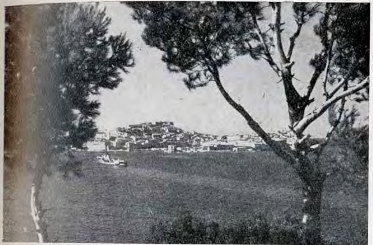
Portoferraio vista dalle Grotte

Il Volterraio - Una bella escursione - comoda per la presenza di una strada assai ben tenuta — è quella del Volterraio, un castello oggi diroccato costruito nel finire del secolo XI dal cittadino Vanni di Gherardo Rau, inviato dai pisani all'Elba appunto per costruirvi fortificazioni. Dai Magazzini parte la strada ripida rivelando ad