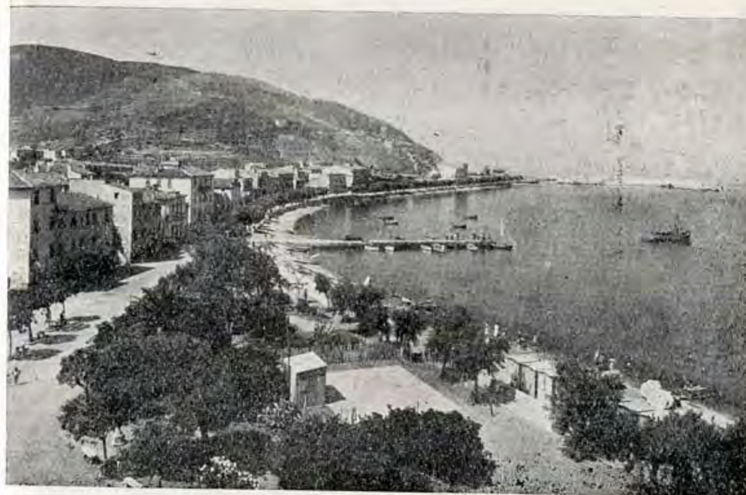
Marciana Marina : la passeggiata a mare

Visiteremo alcune spiagge bellissime di questo centro balneare, che si presterebbe benissimo, se convenientemente attrezzato, a soggiorno invernale, ma vogliamo prima di tutto accennare ad una particolare situazione che deve essere preliminarmente chiarita. Frazione di Porto Azzurro, situata su una collina-promontorio sovrastante il paese e quindi da questo assolutamente isolata, è Longone, tristemente celebre per il suo penitenziario. Non occorre dire che nessun rapporto diretto esiste fra la popolazione di Porto Azzurro e i doloranti nel luogo di espiazione: semmai Porto Azzurro, per la bontà dei suoi abitanti, è una tappa consolatrice per molte famiglie che, recandosi a visitare i congiunti reclusi, vi sostano, accolte con discreta e confortante pietà, prima di iniziar la salita dell'erto colle ove si leva imponente e severa l'antica fortezza fatta costruire da Filippo III di Spagna nel 1603 sul modello della cittadella di Anversa.