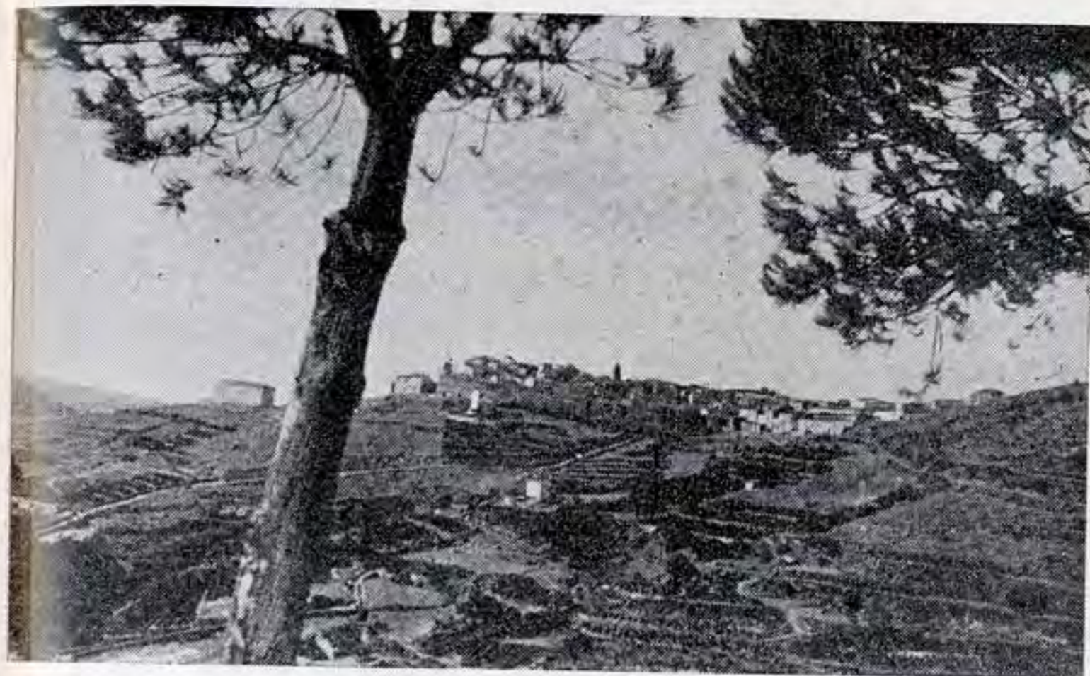
Capoliveri : panorama

Ha ufficio postale e telegrafico, telefono con Rio