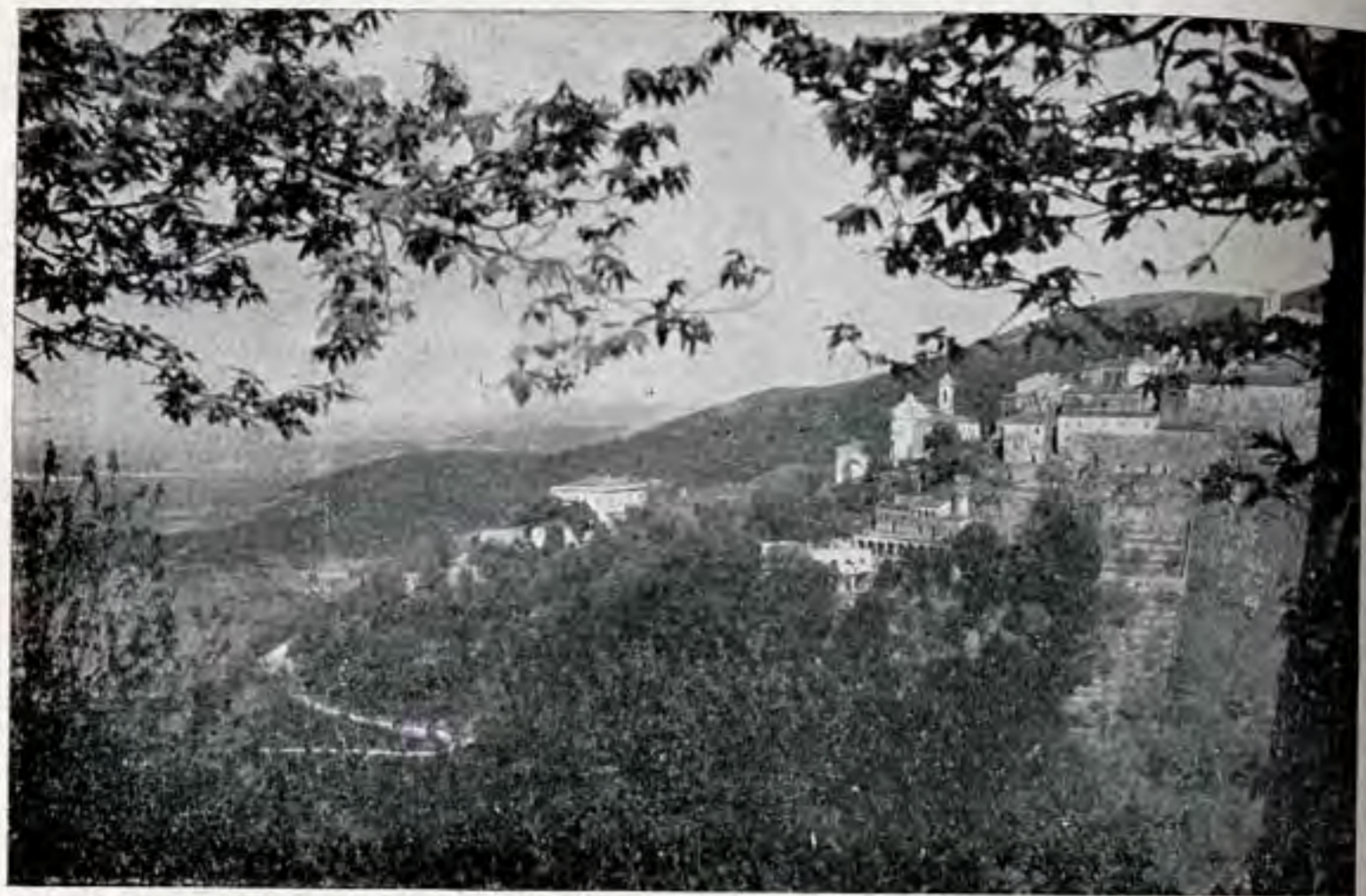
Poggio Terme : panorama del Palazzo Fonte Napoleone Fotocelere Torino - Ediz. Mario Giuliano Tognoli - Livorno