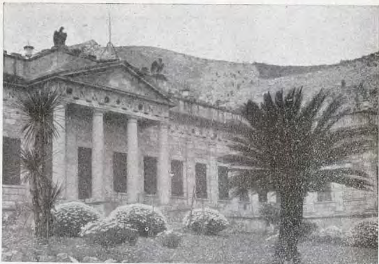
Il Museo Napoleonico a San Martino