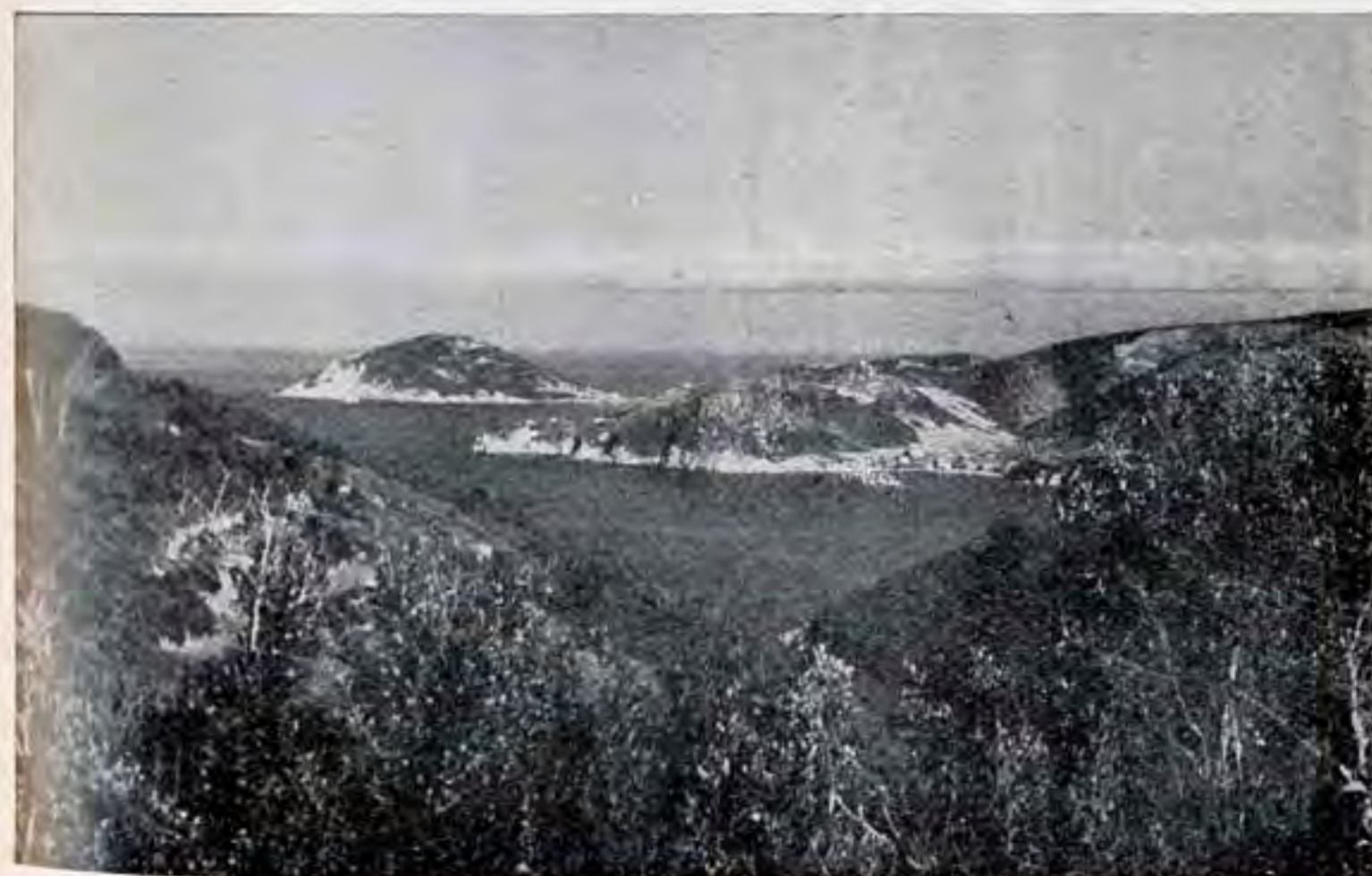
Al Colle Pecorino: il panorama dei tre laghi