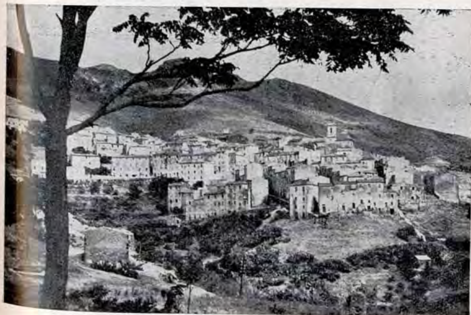
Rio Elba : panorama