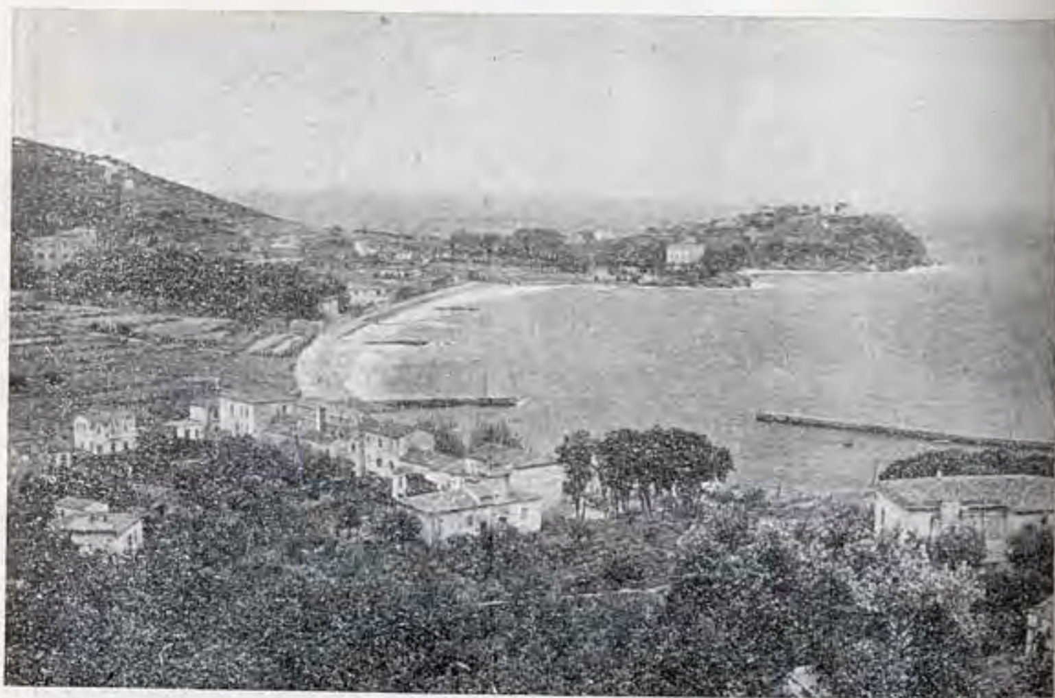
Cavo : la spiaggia e il promontorio di Capo Castello