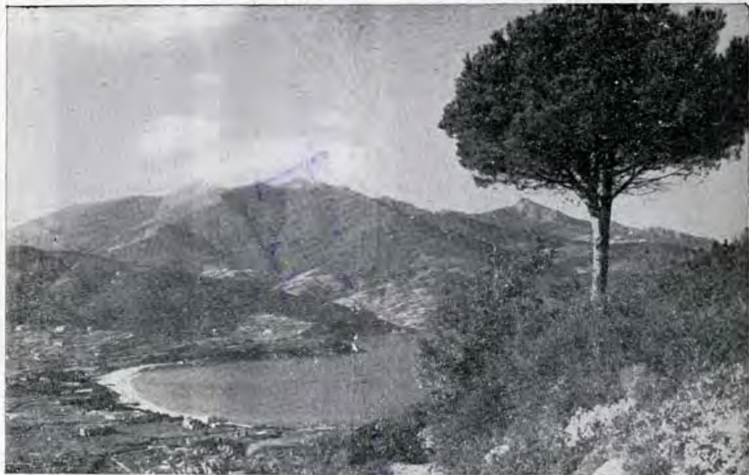
Il golfo di Procchio