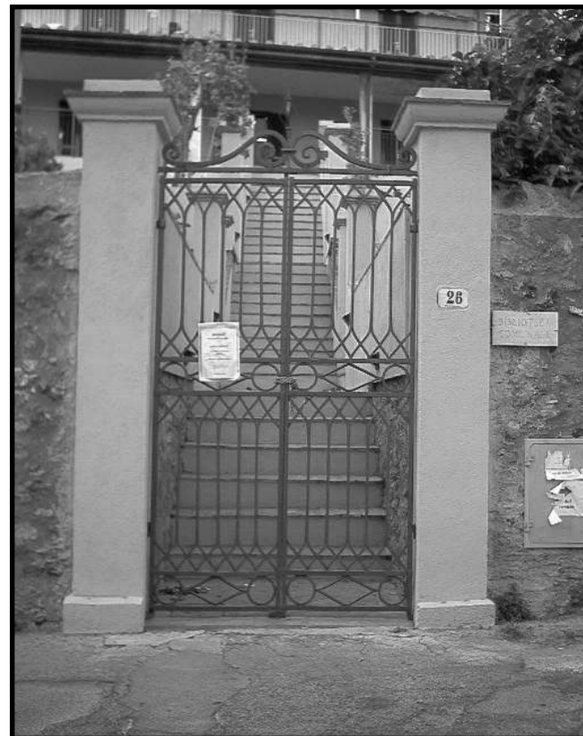
Casa Specos

comunale ne ha comprato il piano terra e lo spazio verde, ed è poi intervenuta con un progetto di riqualificazione dell'area. L'anno scorso ha, infatti, inaugurato i locali come biblioteca pubblica, con centro informatico e importante spazio d'aggregazione sociale per la popolazione, e il 7 agosto scorso, in occasione della presentazione del nuovo libro di Liana Paoli, ha restituito al pubblico il giardino terrazzato, riportato ai vecchi fasti, con muretti di tufo e