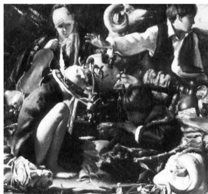
Piccoli zingari si dividono il bottino in una grotta (olio su tela 120x120)

Portoferraio - Torre del Martello, La Linguella- dal 22 agosto al 2 settembre.