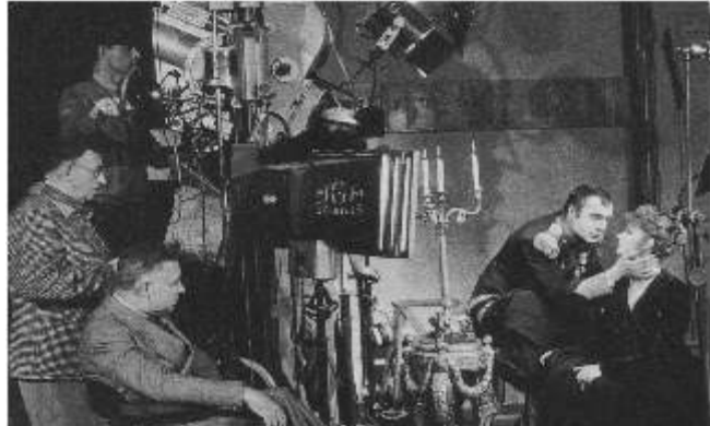
Greta Garbo con Charles Boyer e, seduto, il regista Clarence Brown sul set del film "Maria Walewska"

mente convinta, verso la vetta del romitorio. Sebbene in condizioni diverse: la Garbo era salita con la chiara illuminazione del tiepido sole mattutino, mentre Maria era salita per l'aspro sentiero in una serena e fresca notte di luna, l'impatto con questa natura sarà stato per entrambe incredibilmente affascinante. Raggiunta la piazzetta che immette al romitorio, l'attrice stanca, si lasciò cadere sulla prima panca di