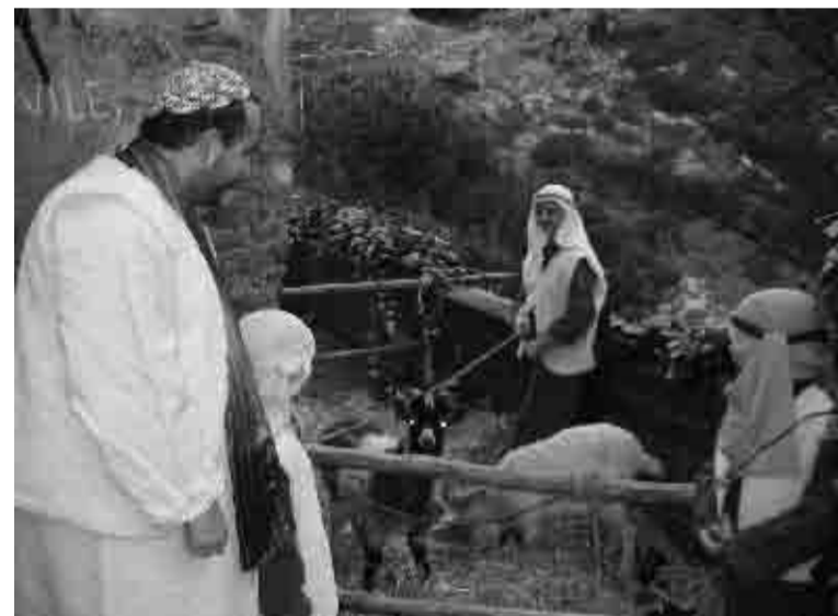
Pastore e pastori