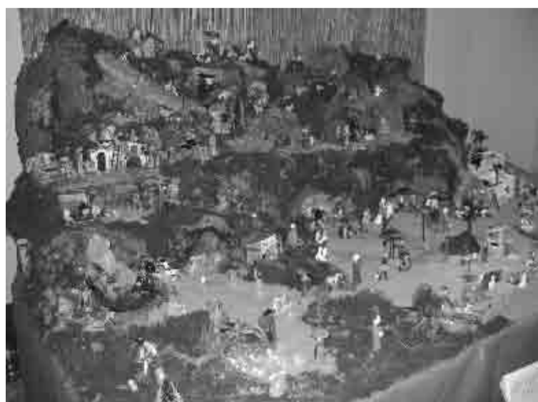
Il Presepe nella Chiesa Parrocchiale

Dopo Marciana Marina e Marciana anche Campo nell'Elba ha finito, purtroppo, di rappresentare con scene animate la nascita di Gesù. Quest'anno a cimentarsi in questa complessa rappresentazione è stata la gente di Rio nell'Elba e l'ha fatto con intelligenza e misura e, in straordinaria coerenza con la sua storia e la sua tradizione, ha celebrato, insieme, il grande mistero della Natività e il grande tema del lavoro.