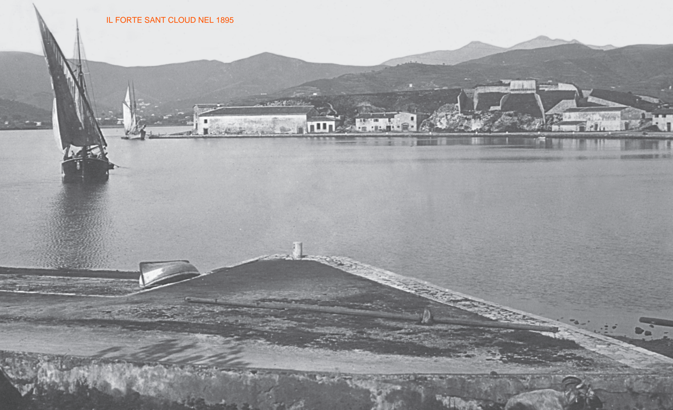
IL FORTE SANT CLOUD NEL 1895