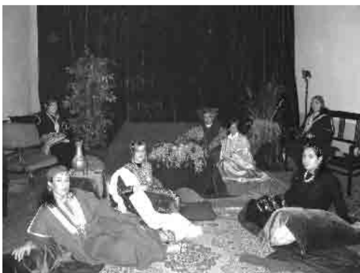
Lusso e lussuria