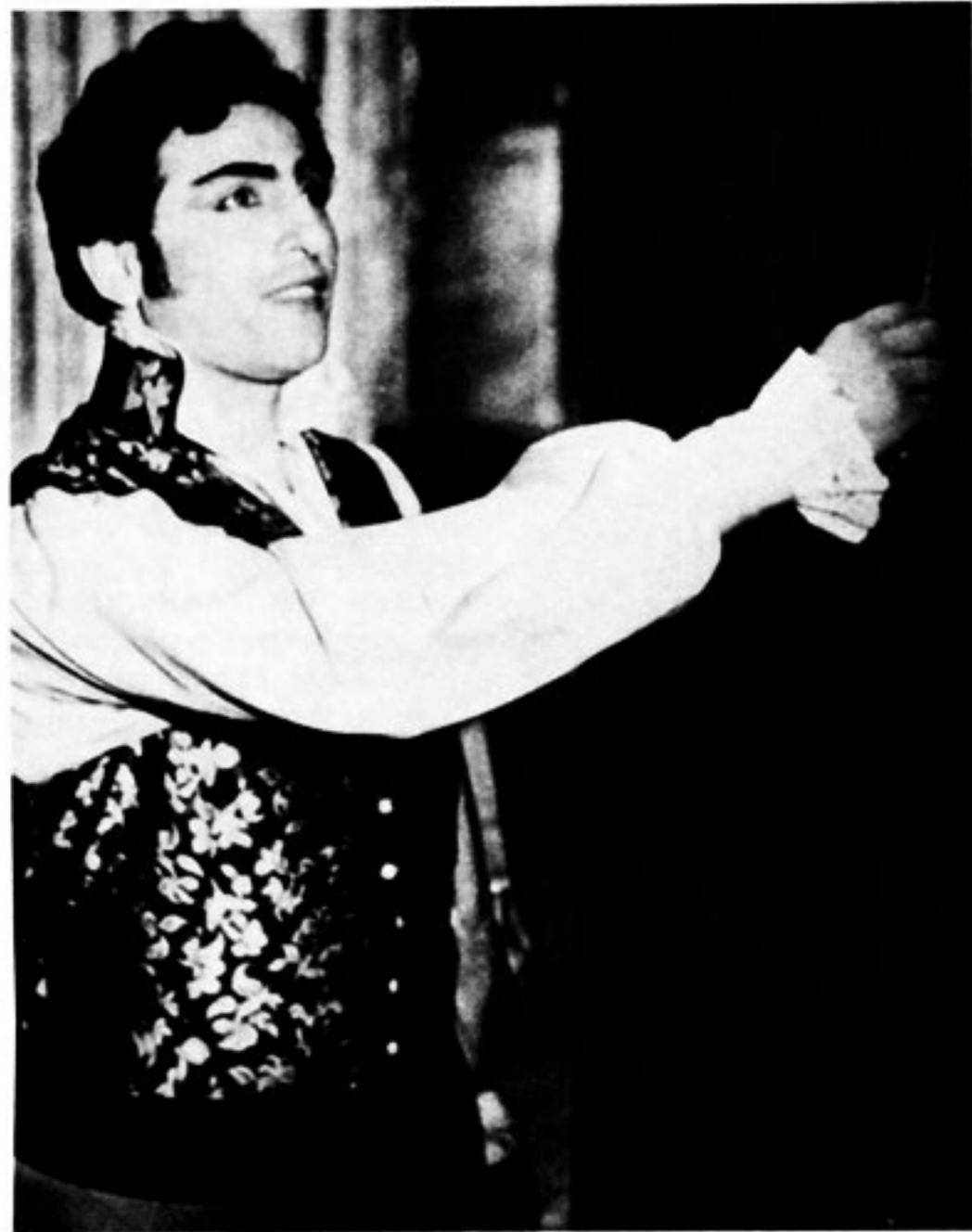
nelle vesti di Cavaradossi interpretò con Maria Callas al Covent Garden di Londra davanti ai Reali d'Inghilterra, la Tosca di Puccini.

In un cd uscito di recente, che riedita una compilation del 1996 per l'etichetta Decca Record, Renato Cioni, figura tra i "40 grandissimi tenori degli ultimi 40 anni". Nel cd, quindi, insieme alle voci di Pavarotti, Carreras, Domingo, Di Stefano, Del Monaco, Bocelli ecc., si può ascoltare anche quella del tenore portoferraiese del quale abbiamo scritto intere colonne quando trionfava con la Callas, la Tebaldi, la Moffo, la Freni, la Sutherland e altre celebri soprano nei più grandi teatri del mondo interpretando un ampio repertorio delle più famose opere liriche. In varie occasioni abbiamo ricordato, essendo un vanto dell'Elba, questi straordinari successi, lo facciamo anche questa volta pubblicando la foto di quanto il 5 luglio 1965,