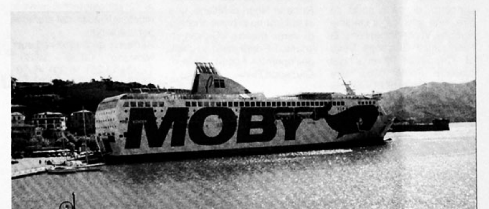
Moby Wonder ormeggiato alla banchina dell'alto fondale

Moby Wonder con le sue 36 mila tonnellate di stazza è certamente il cruise-ferry più grande e più veloce al mondo. Con i suoi 29 nodi di velocità può trasportare 2 mila passeggeri e 700 auto. Quello che tutti non sanno è che questa nave è uscita fuori dalla mia "matita", ovvero gli uffici della Navalmeccanica Elbana di Portoferraio.