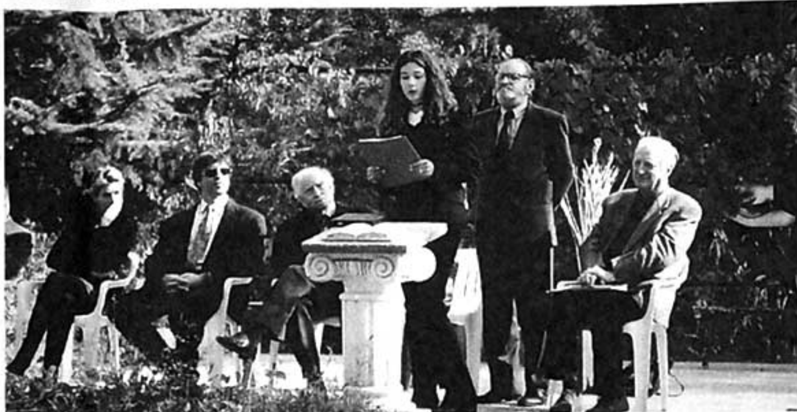
Una studentessa mentre sul palco dell'Open Air Museum di San Martino legge una lettera di Mario Luzi esprime elogi e gratitudine a Italo Bolano.

dedicato da Italo Bolano al poeta Luzi. Alle due cerimonie, grazie alla Comunità Montana che ha messo a disposizione due autopullman, hanno partecipato circa cento studenti dei Licei Classico e Scientifico accompagnati dal preside Giampiero Berti. La loro presenza ha reso più interessante e simpatica la manifestazione.